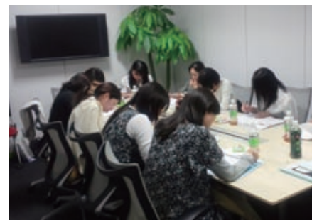
皆さんから具体的、かつ貴重な意見がたくさんとびだしました！参考になる意見ばかりです。